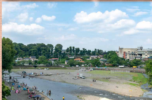
入間川の飯能河原 (飯能市稲荷町・大河原) 新刊に使用した物よりこの写真の方がきれい