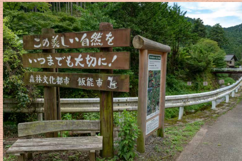
高麗川上流部(飯能市虎秀)の支流 林業(西川林業)が盛ん

入間川とは…… 荒川最大の支流で、飯能市・秩父市・横瀬町境の標高 1294m の大持山が源流。飯能市、入間市、狭山市を流れ、その間に成木川、霞川、越辺川などの支流を合わせ、さいたま市と川越市の境界の上江橋付近で荒川に合流する延長 63km の川。入間川支流の越辺川も、高麗川や都幾川といった本流である越辺川より延長や流域面積が大きな支流を持っている。