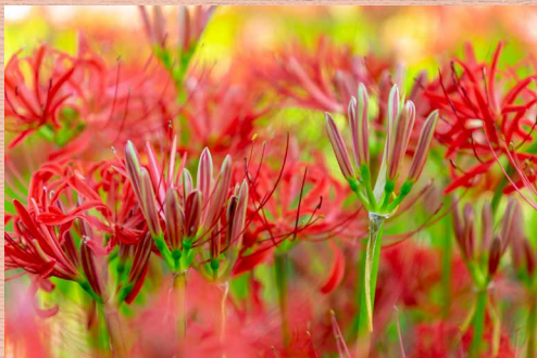
高麗川の中着田 (日高市高麗本郷) 秋には多くの人が訪れる観光スポットとなる 荒川上流河川事務所 ヤマノススメ新聞広告： http://www.ktr.mlit.go.jp/arajo/arajo00784.html

入間川のペーパーを作ろうと思い、作り始めてから筆者自身は都幾川や越生や小川町にも多く行っているにもかかわらず、川と関係する写真がほぼ飯能に固まっていることに気がついた。飯能市は現在サードシーズン放送中の「ヤマノススメ」というアニメの舞台で、7月27日に突然、国土交通省関東地方整備局荒川上流河川事務所とヤマノススメのコラボが発表され、第1回として「水害から命を守る防災情報に関心を！」というタイトルで新聞広告が掲載された。私が年に10回以上飯能に遊びに行くほど好きになった作品であり、新聞広告は荒川上流河川事務所のHPで閲覧できるので、これを読んでいる人が一人でも多く荒川とヤマノススメに興味を持ってくれるとうれしい